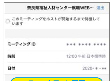
スマートフォン画面

事前確認方法について詳しくは、ステップ2のメールでご案内するマニュアルをご参照ください。